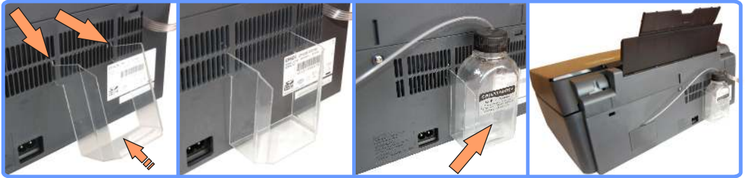
Установка держателя стока CX7300

Так Вы сможете визуально контролировать наполнение ёмкости отработанными чернилами и при наполнении ёмкости, легко опустошать её.