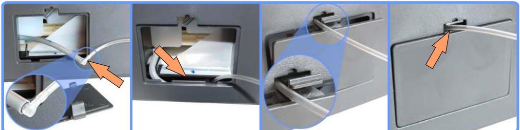
Удлинение капилляра стока CX7300

Уложите место соединения, как показано на фото, и установив на место крышку, выведите капилляр через щель в защёлке.